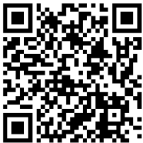
GEM JEUNES "DI'GEM"