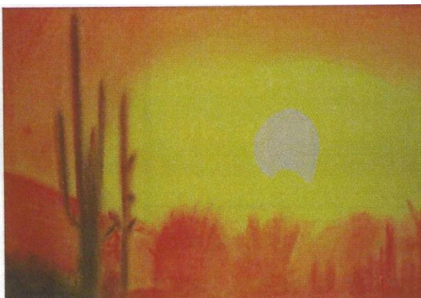
Illustration réalisée par un adhérent du GEM d'Angoulême : "Suis ton chemin"

VOUS N'ÊTES PAS SEUL, L'UNAFAM PEUT VOUS AIDER !