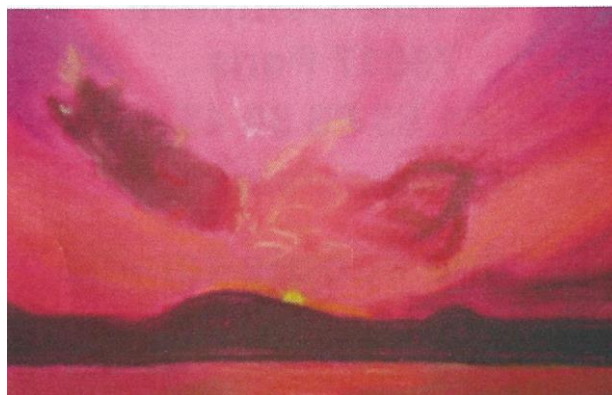
Illustration réalisée par un adhérent du GEM d'Angoulême : "Suis ton chemin"