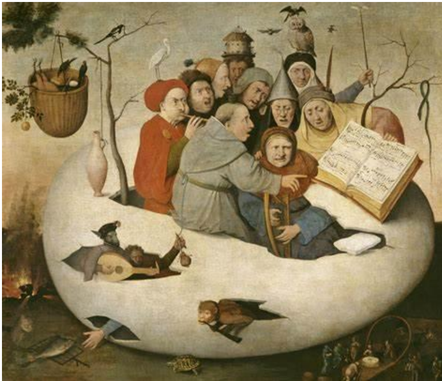
« Le concert dans l'oeuf » Hieronymus Bosch (1450-1516)

Cette exposition ambitieuse et stimulante entend aborder la figure typiquement médiévale du fou à travers ses représentations. Elle rassemblera au sein d'un parcours chronologique et thématique plus de 300 œuvres : sculptures, objets d'art (ivoires, coffrets, petits bronzes), médailles, enluminures, dessins, gravures, peintures sur panneau, tapisseries.