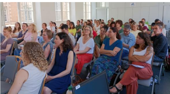
Une assistance nombreuse et attentive