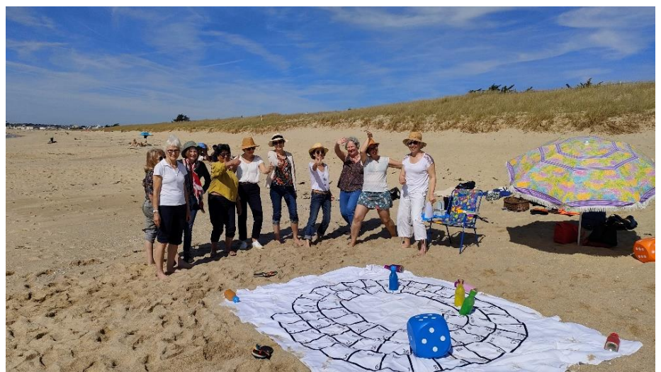
Journée détente du 13 avril sur la côte