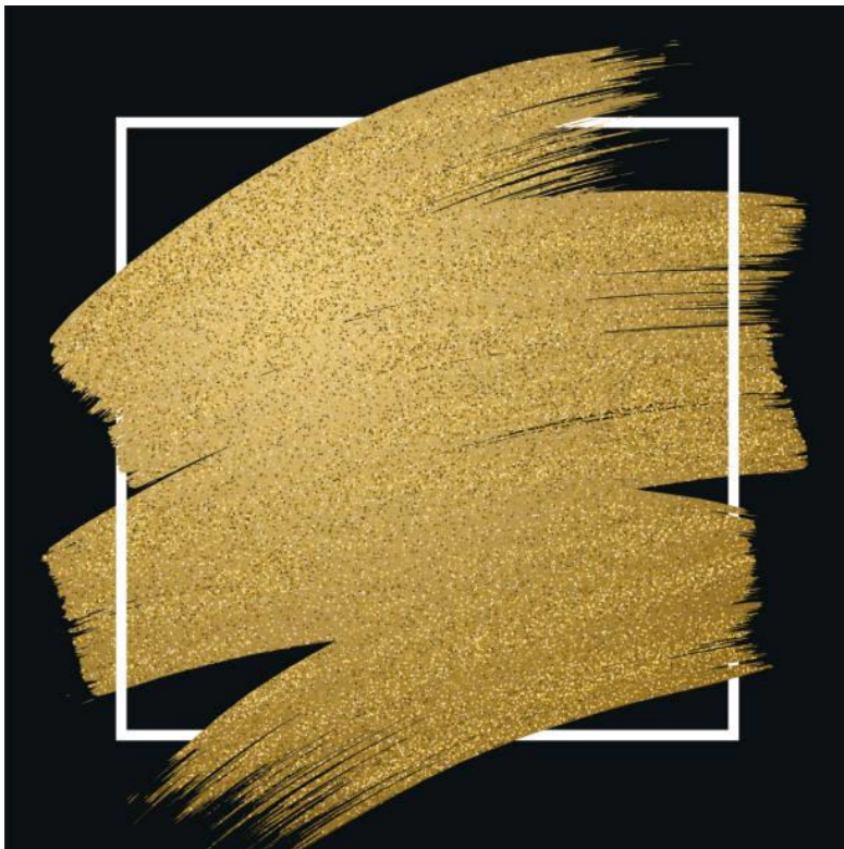
Art et vie – Artiste inconnu

https://www.unafam.org/sinformer/M%C3%A9diath%C3%A8que/magazine-un-autre-regard/un-autre-regard-2022-ndeg4