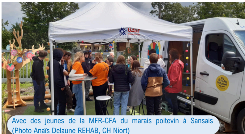
Avec des jeunes de la MFR-CFA du marais poitevin à Sansais