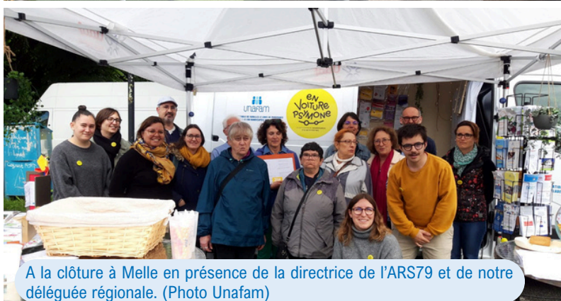
A la clôture à Melle en présence de la directrice de l'ARS79 et de notre déléguée régionale.

Une page Instagram a également été créée pour toucher ce public, faire connaître plus largement l'Unafam et ses partenaires et faire vivre Psymone en-dehors de la tournée [2].