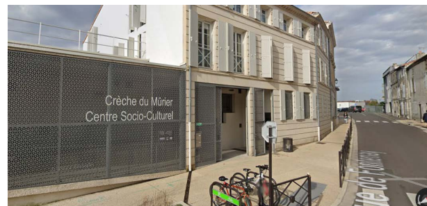
CSC Centre Ville - Capture d'écran Google Maps

Les membres du Bureau et bénévoles de l'Unafam 79 vous remercient de votre soutien. Nous vous attendons nombreux !