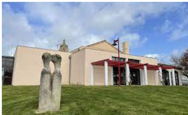
Foyer Hérault de Bressuire

Les membres du Bureau et bénévoles de l'Unafam 79 vous remercient de votre soutien. Nous vous attendons nombreux !